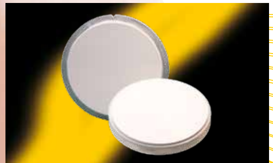
Scheiben mit Kunststoffring Ø 112mm + Ø 98,3mm - 10mm / 12mm / 14mm / 16mm / 18mm / 20mm / 25mm

> große Auswahl an Materialien und Systemen