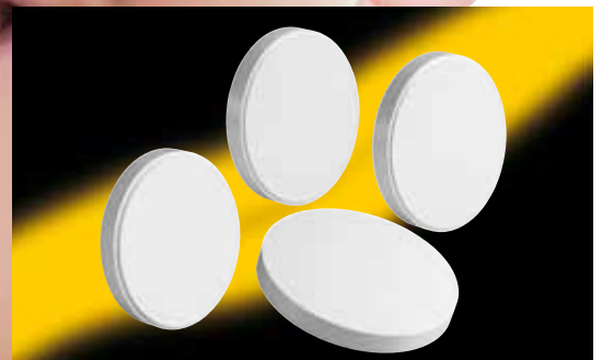
Zeno ™ kompatibel Ø 98,3mm - 10mm / 12mm / 14mm / 16mm / 18mm / 20mm / 25mm